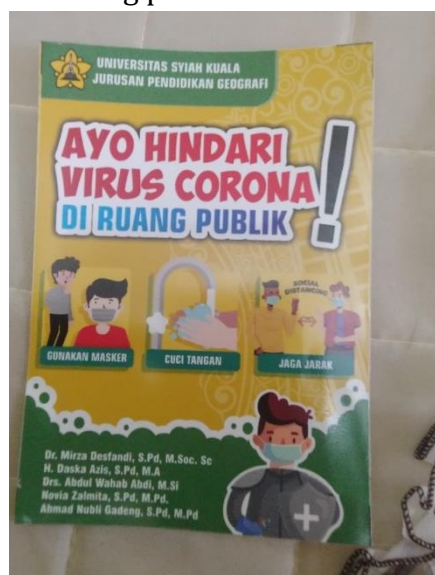
Gambar 3. Stiker Sosialisasi Mitigasi COVID-19

Pada Tahap pelaksanaan pengabdian tim mendistribusikan dan menempel stiker COVID-19 yang sudah selesai dicetak di lokasi pengabdian. Sosialisasi ini dilakukan di berbagai fasilitas publik seperti di pasar, warung nasi, warung kopi, masjid dan meunasah yang tersebar di Kota Banda Aceh dan Kabupaten Aceh Besar. Dengan demikian masyarakat akan selalu diingatkan untuk melaksanakan protokol kesehatan terutama ketika sedang berada di ruang publik.