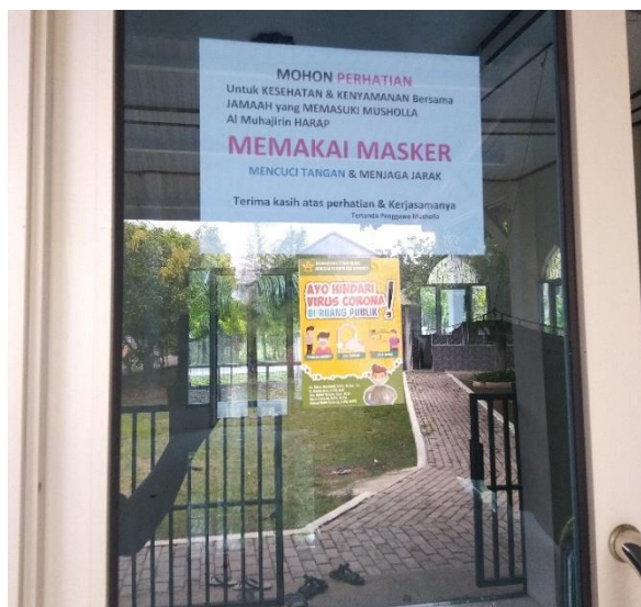
Gambar 4. Stiker yang ditempel di pintu masuk Mushalla Komplek Perumahan Dosen Universitas Syiah Kuala Desa Blang Krueng, Kecamatan Baitussalam, Kabupaten Aceh Besar.