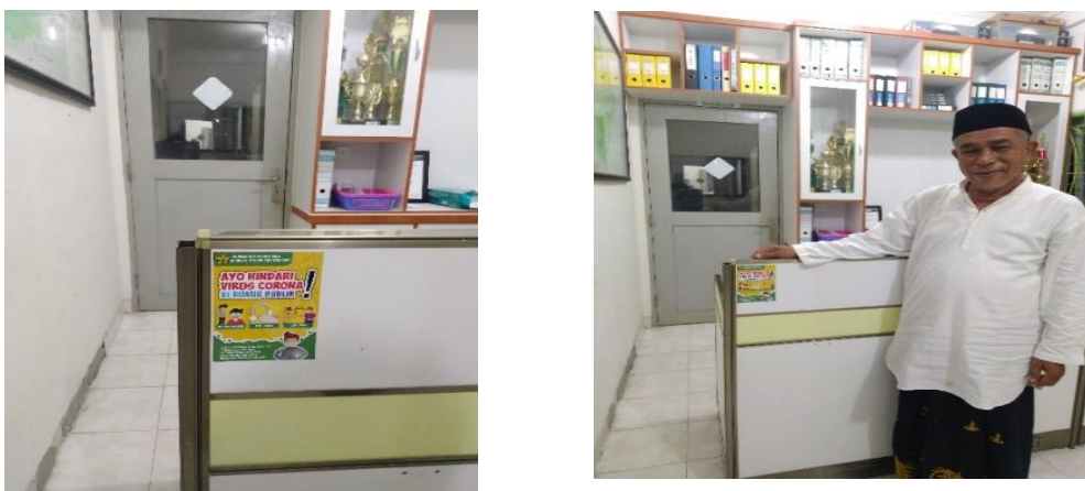
Gambar 6. Stiker yang ditempel di kantor kepala desa Blangkrueng, Kecamatan Baitussalam. Kabupaten Aceh Besar

Semua kegiatan yang dilakukan didokumentasikan dalam bentuk video yang dapat diakses pada link berikut: https://youtu.be/DfDnCrrJUrU . Selain itu juga dilakukan publikasi kegiatan di media massa online yang dapat diakses pada link berikut: https://acehsiana.com/2020/12/15/jurusan-pendidikan-geografi-unsyah-sosialisasi-pencegahan-covid-19/ . Berikut akan ditampilkan Gambar 7 memperlihatkan stiker yang ditempel di mobil tim anggota pengabdian. Diharapkan dengan bergerak mobil yang sudah ditempel stiker mitigasi bencana COVID-19, maka membuat informasi akan dapat disampaikan kepada masyarakat yang melihat dan membaca stiker ini.