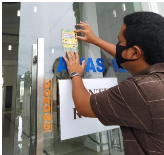
Gambar 5. Ketua Pengabdian ketika menempel Stiker di Mesjid Desa Berabung, Kecamatan Darussalam, Kabupaten Aceh Besar

Setelah kegiatan pelaksanaan selesai kemudian tim pengabdian membuat laporan pelaksanaan pengabdian yang disahkan oleh dekan Fakultas Keguruan dan Ilmu Pendidikan Unsyiah dan Ketua LPPM Unsyiah. Menurut tim pengabdian, dengan membiasakan ketiga perilaku tersebut, akan dapat melindungi masyarakat Kota Banda Aceh dari COVID-19, serta berperan dalam rangka memutuskan mata rantai penyebaran COVID-19 di Aceh khususnya dan Indonesia pada umumnya. Manfaat yang akan dirasakan yaitu dapat menekan jumlah penyebaran COVID-19 dalam masyarakat, sehingga keadaan kembali normal dan masyarakat dapat melakukan kembali berbagai aktifitas ekonomi dan sosial.