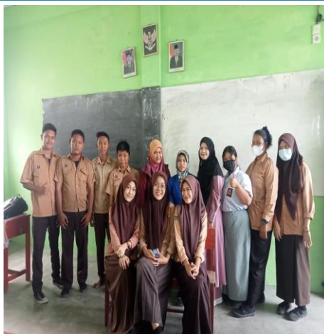
Gambar 2. Foto bersama dengan peserta siswa/I SMK Hasanuddin