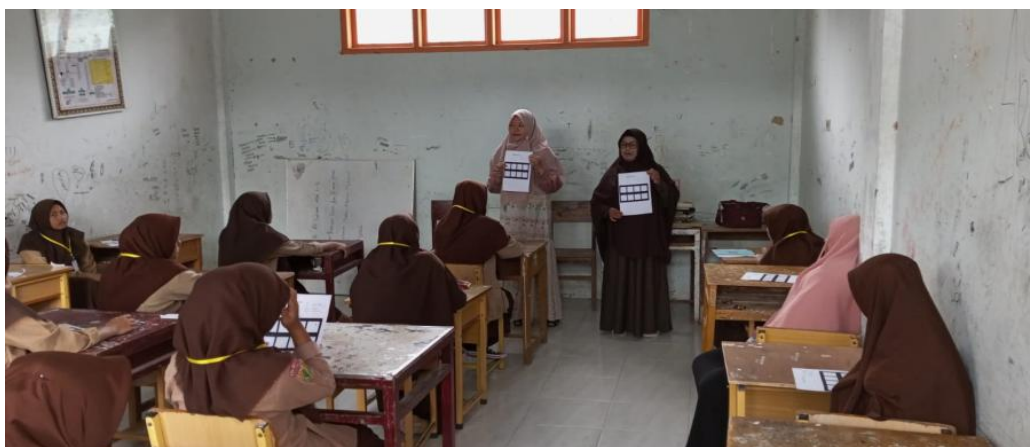
Gambar 3. Proses Penjelasan Tes Psikologis