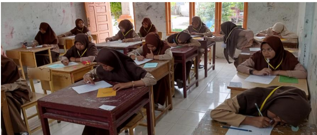
Gambar 2. Proses Pelaksanaan Tes Psikologis

Memahami minat dan bakat peserta didik merupakan hal yang perlu dilakukan oleh sekolah. Bagi siswa mengenal minat dan bakat bermanfaat untuk mengenali potensi diri, mengetahui pilihan potensi pengembangan diri serta membuat pilihan karir sesuai bakat (Magdalena, dkk, 2020; Huljannah, 2021). Bagi sekolah pengenalan minat dan bakat siswa memudahkan guru dalam membuat program layanan bimbingan dan konseling karir sehingga dapat mengarahkan siswa untuk memilih profesi atau karir yang sesuai (Sastraatmadja, & Darmiyanti, 2023). Siswa yang tidak mengenali minat dan bakatnya siswa dapat mengalami kekeliruan dalam memilih program studi, kesulitan dalam mencapai hasil belajar yang optimal (Yonanda, dkk, 2022).