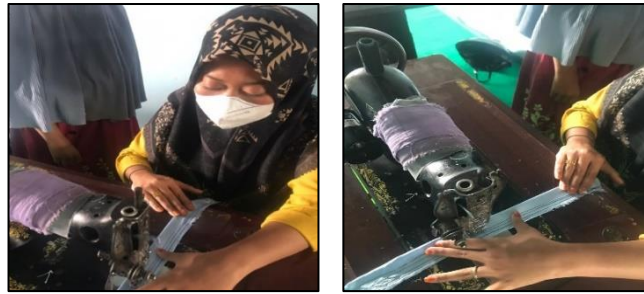
Gambar 2. Kegiatan menjahit Scrunchie

Seluruh peserta lalu diminta untuk praktik menjahit scrunchie secara bergantian. Karena keterbatasan mesin jahit, setiap peserta menjahit 1 buah scrunchie . Tahap ini berlangsung dengan baik. Antusias dan partisipasi peserta sangat baik pada tahap ini. Beberapa peserta pelatihan yang telah menyelesaikan scrunchie -nya, berinisiatif untuk membantu peserta yang lain. Pada hari ke-dua pelatihan, telah terkumpul 28 scrunchie yang berasal dari 28 peserta pelatihan.