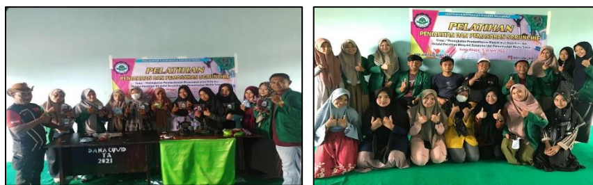
Gambar 5. Penutupan kegiatan pengabdian

Pemasaran secara online , baik lewat sosial media dan e-commerce merupakan hal yang lumrah di era ini. Beberapa literatur menunjukkan peningkatan daya beli secara online pada kurun waktu tiga tahun terakhir (Herosian & Samvara, 2019; Rakhmawati et al., 2021). Namun, terdapat kendala dalam memasarkan online , yakni tidak adanya jaringan internet di Desa Rata Ara. Sejauh ini, jaringan internet hanya dapat diakses di Kantor Reje, dengan sinyal dan koneksi yang relatif lemah. Untuk dapat mengakses internet dengan kecepatan yang relatif stabil, warga Desa Rata Ara harus pergi ke desa tetangga, Desa Singah Mulo, yang berjarak sekitar 6 Kilometer.