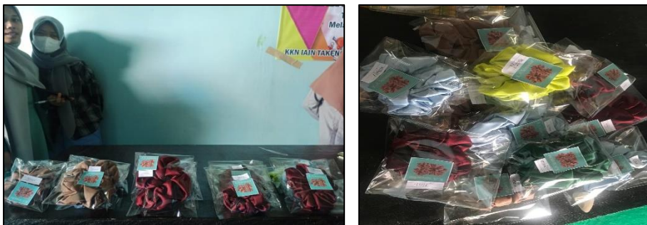
Gambar 3. Scrunchie yang telah dikemas

Pada hari ke-tiga dan ke-empat, kegiatan pengabdian ini berupa pemberian materi tentang teknik pemasaran scrunchie secara online dan offline . Materi ini terbagi menjadi dua, yaitu; (1) Pengemasan ( packaging ), dan (2) Pemasaran. Tim Pengabdi IAIN Takengon memberikan materi pengemasan scrunchie dengan menggunakan modal yang minimalis, tanpa mengurangi estetika dan nilai ekonomis produk.