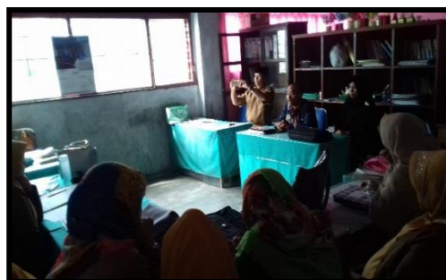
Gambar 1. Rapat Pemantapan Acara

Rapat pemantapan rencana kegiatan dilaksanakan pada hari Minggu 6 November 2022 dengan peserta rapat tim pengabdian dan para guru beserta kepala sekolah. Hasil dari rapat tersebut bahwa kegiatan pasti dilaksanakan pada hari Senin, 7 November 2022. Rencana awal siswa yang bisa mengikuti pelatihan ini hanya siswa dengan tingkat kategori tuna sedang dan ringan yang berjumlah lebih kurang 18 orang. Karena berbagai pertimbangan dan memperkecil resiko kegaduhan Kepala sekolah mengintruksikan semua siswa harus ikut dalam pelatihan tersebut. Resiko yang diminimalisir adalah kecemburuan siswa tuna ini sangat tinggi, pemisahan mereka akan menimbulkan dampak kontraproduktif bagi kegiatan. Untuk menambah personil dalam penanganan mahasiswa para guru piket diikutkan dalam kegiatan sebagai pendamping atau co Fasilitator.