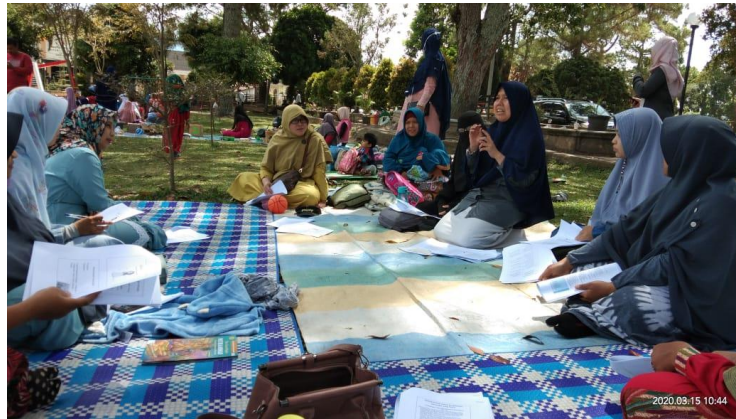
Gambar 2. Bincang-bincang Santai

Dari kegiatan bincang santai ini, para ibu rumah tangga komunitas Soloh mengharapkan kegiatan dapat dilanjutkan. Mereka berkomitmen untuk tetap melakukan edukasi-edukasi mengenai keuangan pada periode-periode mendatang. Mereka juga mengharapkan bisa dilakukan evaluasi program pengelolaan keuangan di masa yang akan datang.